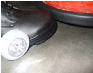
Das Beispiel zeigt eine typische Anwendung mit Rundungen. TS19 aufgeklebt an einem Elektro-Hubwagen.