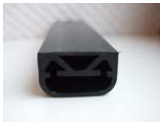
Profil ohne Klebeband