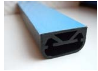
Profil mit Klebeband