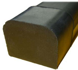
mit aufgesteckter Endkappe